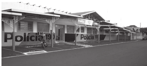
Núcleo será inaugurado na manhã desta sexta-feira na sede da 3ª Cia

tório de água com capacidade de 150 mil litros que irá atender a população do bairro e adjacências. Também temos que falar da escola Municipal de Educação Infantil 'Irmã Maria Domênica Morino', onde foi instalado reservatório de água com capacidade para 10 mil litros. Além disso, foram adquiridos brinquedos para playground e educativos e está acontecendo a construção de muro em volta do prédio em substituição ao alamedado, que além da proteção ao patrimônio escolar irá garantir privacidade na realização das atividades e oferecer segurança aos alunos. Enfim, em busca do melhor para o cidadão. E isto se faz com muito trabalho e apoio como o que recebemos da Câmara de Vereadores, a quem agradecemos e continuaremos contando".