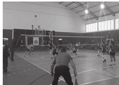
Meninas do vôlei também estrearam ontem em partida realizada em Assis