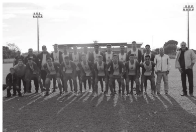
Jogadores de CM 'lutaram' muito mas não conseguiram marcar; partida contra Santacruzense ficou em 0 a 0

"Convidamos a comunidade a participar das partidas, já que teremos jogos em Cândido Mota praticamente todos os dias. Nesta primeira fase, a modalidade de futebol de campo terá jogos no estádio 'Benedito Pires', completou 'Pinguinha'. Os atletas de Cândido Mota que participam dos Jogos Regionais receberam uniformes completos, contendo camiseta, shorts e meia para futebol de campo, da Casa Di Conti.