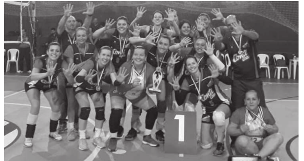
Em 20 anos o vôlei feminino de CM só ficou fora da semifinal em duas edições dos 'Regionais'; são nove títulos, dois vices, cinco terceiros e dois quartos lugares