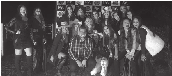
Baile da Rainha do 'Gigante Vermelho' vai acontecer na sede social do CRB de CM

O concurso que irá eleger a rainha, a primeira e a segunda princesas, a