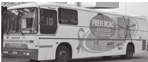
Unidade móvel da AAPC estará em CM no dia 12 de setembro, na praça da matriz

O papanicolaou é um exame simples e rápido, que colhe células do colo do útero para análise em laboratório. E seu principal objetivo é prevenir contra o câncer de colo de útero. Ele tem esse nome por causa de seu inventor, o médico romeno Georgios Papanicolaou, que o tornou célebre nos anos 1940. Devem-se submeter ao exame mulheres na faixa etária de 25 a 64 anos e que já tiveram atividade sexual. No entanto, ginecologistas afirmam que não há uma idade certa, já que assim que inicia a sua vida sexual, a mulher já deve começar a realizar a citologia.