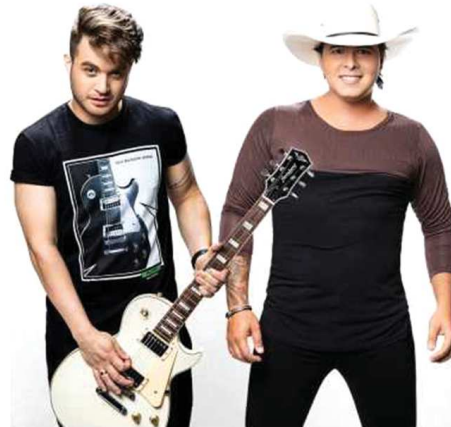
Festa em Pedrinhas Paulista vai de 18 a 22 de setembro e encerramento contará com show com a dupla Conrado & Aleksandro

Neste dia 21, Pedrinhas Paulista, Município de Interesse Turístico, comemora 67 anos e para marcar a data a prefeitura, com apoio da Câmara de Vereadores e do Comtur (Conselho Municipal de Turismo), preparou uma extensa programação de eventos que devem atrair grande público da cidade e também da região. As celebrações começam neste dia 18, com o Sarau na Praça, com o tema 'Cordel Encantado'. REGIÃO Página 5