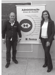
Da Redação Cândido Mota

Em evento promovido na escola de Cândido Mota, alunos são apresentados ao curso de Administração