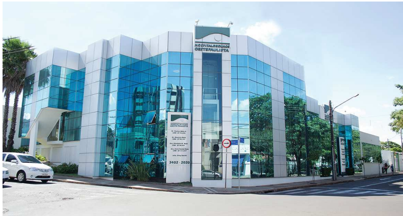
Médicos do Hoop de Assis participaram ativamente do trabalho que recebeu maior prêmio mundial da oftalmologia