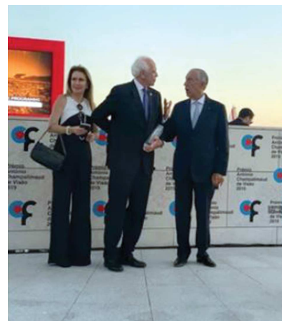
Presidente de Portugal Marcelo Rebelo de Souza entrega prêmio a profissionais que atuaram no trabalho

E completou: "O júri do prêmio é constituído por um distinto painel de reputados cientistas internacionais e de notáveis figuras públicas, cujas vidas têm sido dedicadas à resolução dos problemas e à supressão das necessidades do mundo em vias de desenvolvimento. Este prêmio demonstra a importância da oftalmologia brasileira no cenário mundial, impactando na melhoria na qualidade de vida das pessoas".