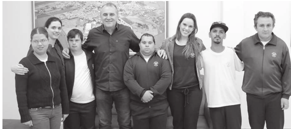
Diretora, coordenadora e alunos estiveram no gabinete convidando o prefeito para atividades do 'Setembro Verde'