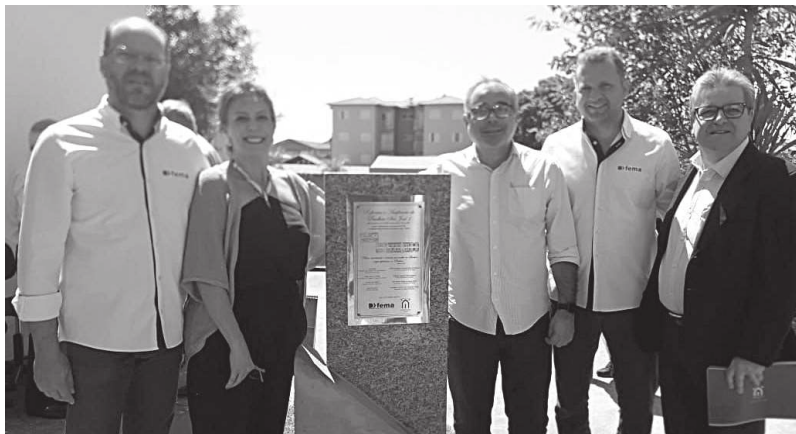
Convênio entre instituição e Fema foi firmado promoverá reforma e ampliação de toda ala de atendimento SUS do hospital central