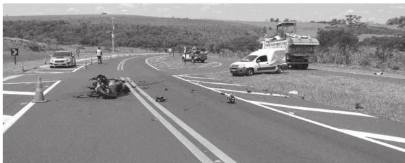
do, dia 19, depois de sua motocicleta se chocar com a lateral de uma Fiorino no trevo de acesso a Paraguaçu Paulista e Oscar Bressane, na rodovia