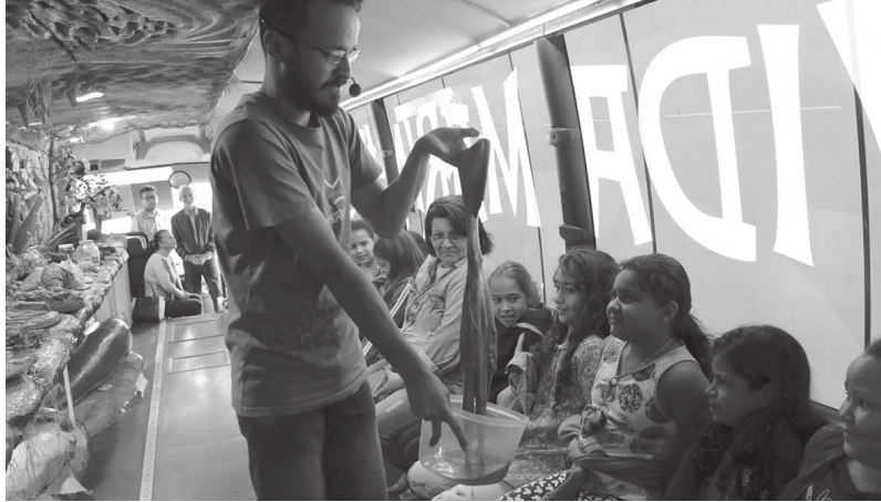
Alunos da rede municipal de ensino de CM estão participando de aulas práticas sobre vida marinha