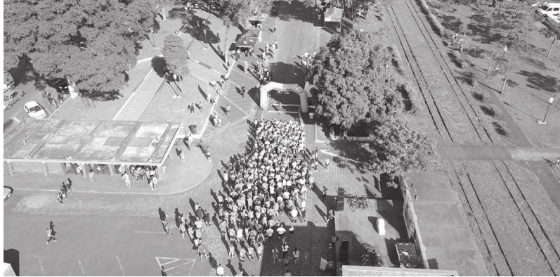
Dentro da programação de aniversário, no domingo, dia 27, aconteceu a 1ª Meia Maratona de Cândido Mota