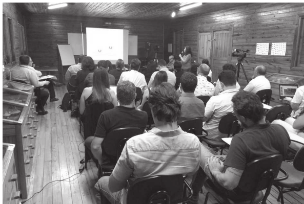
Participantes apresentaram análises e propostas de proteção à fauna durante a duplicação da SP-333

Em parceria com o Instituto Florestal de Assis (IF), a Entrevias reuniu especialistas ambientais, representantes de órgãos licenciadores, Ministério Público e profissionais de engenharia e concessão rodoviária num Workshop de Ecologia de Estradas e Fauna Silvestre, realizado na última quarta-feira, dia 24, em Assis. Cerca de 50 pessoas discutiram o assunto juntamente com integrantes do Grupo de Atuação Especial de Defesa do Meio Ambiente (Gama), Secretaria Municipal de Agricultura e Meio Ambiente (Seama), Cetesb (Companhia Ambiental do Estado de São Paulo), Agência Paulista de Tecnologia dos Agronegócios (Apta), Unesp de Rio Claro e Universidade Federal do ABC (UFABC). O encontro foi propositivo e apresentou análises e soluções técnicas que podem ser adotadas a fim de