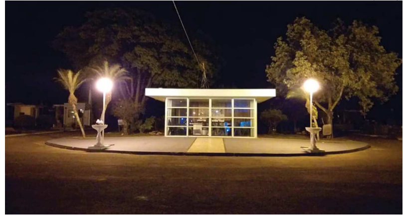
José Clóvis Zambito/Jornal Atenção