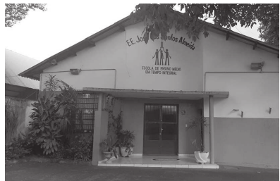
A Escola Estadual José dos Santos Almeida, o 'Grupinho Integral', passa a atender, já a partir deste ano, o Ensino Fundamental - Anos Finais

6º ano do Ensino Fundamental até a 3ª série do Ensino Médio. "Prova disso, é a procura por matrícula em todas as séries, além do interesse das famílias em querer conhecer com mais detalhes os princípios do Programa Ensino Integral e seu funcionamento", disse. Ela ainda disse estar muito satisfeita com o interesse das famílias, e convida os candido-motenses que desejam conhecer a escola e o diferencial oferecido dentro dos princípios do Programa de Ensino Integral, pode procurar a escola de segunda à sexta-feira, das 7h00 às 17h00. O 'Grupinho' fica na rua Ângelo Pipolo, 94, no centro de Cândido Mota.