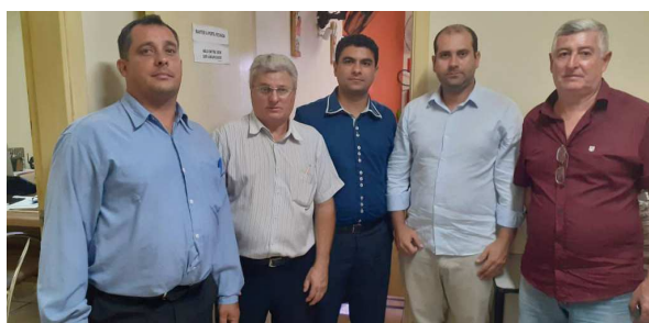
Advogado da CNPA e representantes das colônias estiveram em O Diário do Vale

barragem no município de Salto Grande, registradas nos últimos dias. O encontro ocorreu no auditório 'Gilfredo Boretti', da Câmara Municipal de Cândido Mota. CIDADE Página 4