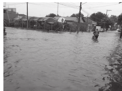
Trecho da rua Félix Jabur ficou alagado

Na região de Cândido Mota há pontos considerados mais suscetíveis ao acúmulo de água e que, portanto, devem receber a atenção redobrada dos motoristas. Entre Cândido Mota e Assis, na rodovia Benedito Pires, há vários pontos de alagamento. Inclusive, na manhã desta segunda-feira, dia 10, o trânsito acabou ficando parado por alguns minutos. Outra região que também alaga é na rodovia Francisco Gabriel da Motta, entre Cândido Mota e a rodovia Raposo Tavares, na região da pis-