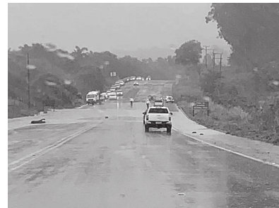
Rodovia Benedito Pires ficou interditada devido ao acúmulo de água na pista