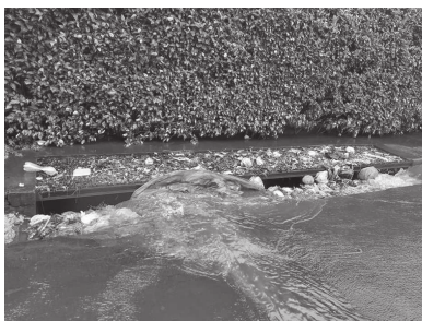
Lixo em 'bocas de lobo' causam alagamento

A rua Félix Jabur, entre as ruas Carmo Chadi e Augusto Gozzi, no centro de Cândido Mota, também ficou alagada, impossibilitando o tráfego, assim como a rua José Laurindo de Almeida, no parque Santa Cruz, onde houve registro de fotos mostrando grande quantidade