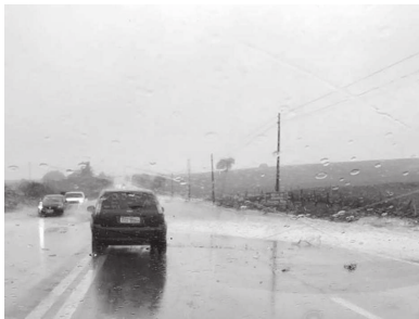
Ponto de alagamento registrado por motorista na rodovia Fortunato Petrin