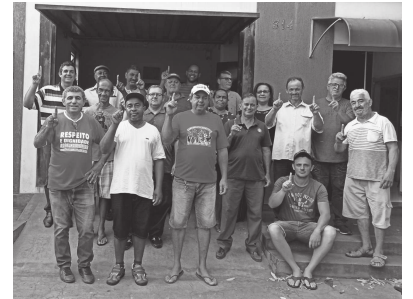
Chapa eleita com 158 votos Chapa 1 'A Luta Continua com Independência e Trabalho'

Da previsão inicial de 400 eleitores, votaram 224 funcionários, entre ativos ou inativos, das cidades de Cândido Mota, Palmital e Florínea, todos associados à entidade. O processo eleitoral teve urna fixa na sede do Sindicato dos Municipais, em Cândido Mota, e outras três urnas itinerantes, que percorreram os setores, distritos, e as cidades de Palmital e Florínea. A apuração aconteceu a partir das 17h, na sede da entidade, em Cândido Mota. O resultado final foi proclamado por volta das 18h30.