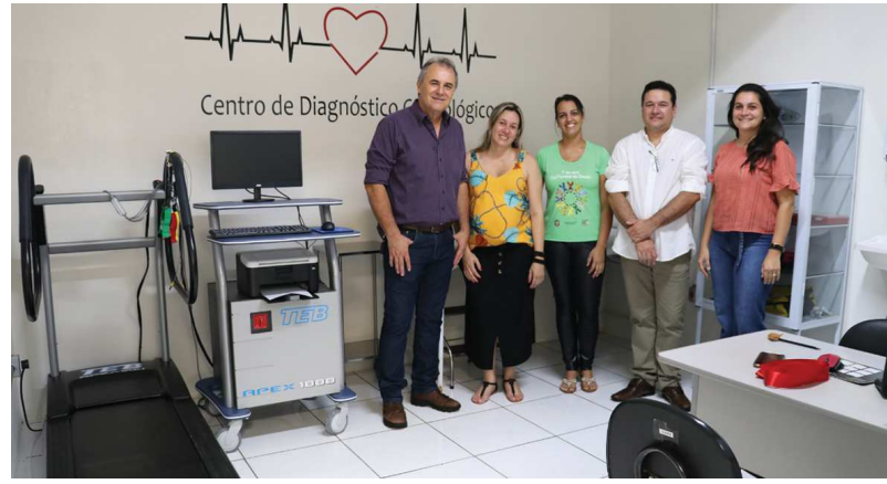
Da Redação Cândido Mota