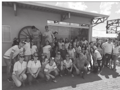
Por meio de projeto com tema voltado ao agronegócio, a escola 'José dos Santos Almeida', o 'Grupinho Integral' prestou homenagem às mulheres do campo