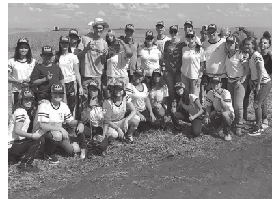
Por meio de projeto com tema voltado ao agronegócio, a escola 'José dos Santos Almeida', o 'Grupinho Integral' prestou homenagem às mulheres do campo