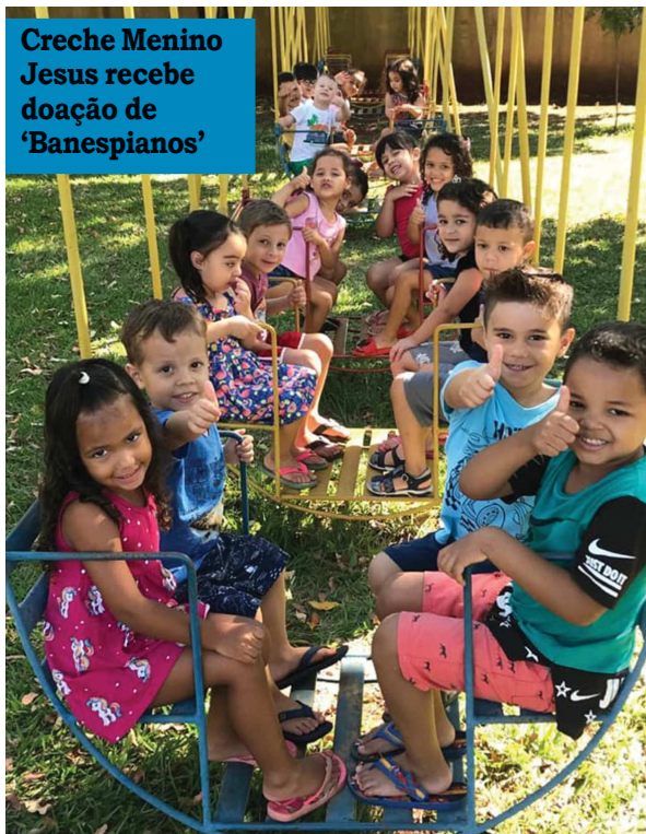
Creche Menino Jesus recebe doação de 'Banespianos'