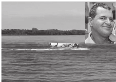
Da Redação Cândido Mota

As equipes do Corpo de Bombeiros de Cândido Mota, Assis e Marília continuam as buscas pelo homem que desapareceu no rio Paranapanema na tar-