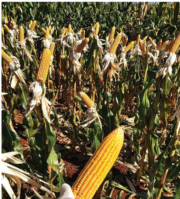
Um bom planejamento de safra se configuraria como um fator crucial para bons rendimentos e de rentabilidade do milho, ou de qualquer outra cultura

te período com ausência hídrica varia consideravelmente entre uma propriedade e outra, conforme os tratos culturais realizados, não só nesta safra, como também em oportunidades anteriores. COTIDIANO Página 4