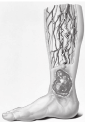
Varizes: a raiz do problema

A úlcera é um ferimento na pele, que pode ser decorrente de um machucado, uma batida ou um corte, ou ainda aparecer espontaneamente. Algumas úlceras cicatrizam rapidamente e outras demoram ou nunca fecham. Isso depende da presença ou não de doenças da circulação, pressão alta, diabetes, inflamações e infecções da pele, etc. Os problemas na circulação venosa são a principal causa para o aparecimento das feridas nas pernas, responsável por 70% das úlceras de membros inferiores.