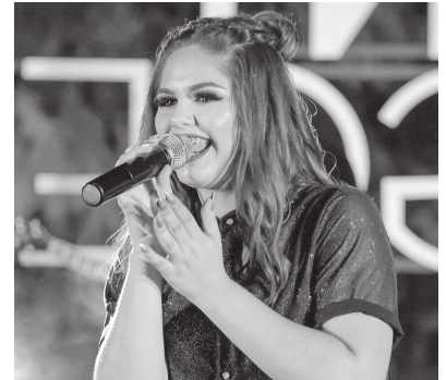
O clipe de 'Chuta Balde' pode ser assistido no canal oficial da cantora no YouTube e a música está disponível em todas as plataformas digitais.