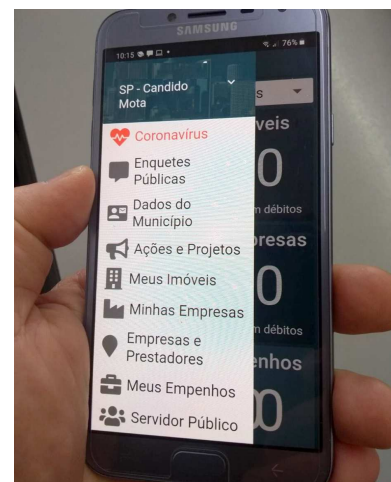
Da Redação Cãndido Mota

suntos pertinentes à população, entre outros. CIDA-DE Página 6