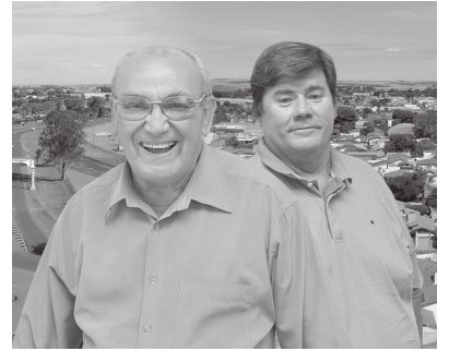
Santo Reis, do Divino, Festa do Milho, Festa Junina.

O nosso plano de governo propõe a criação de rotas turísticas para áreas rurais, como Rota da Pinguela, Porto Almeida, Nova Alexandria e outras. Renovação, revitalização e reativação do balneário municipal do Porto Almeida. Adequação dos parques ecológicos para uso pleno, como o Panário e ao lado da piscina pública e a própria piscina pública. Criação de rotas para pesca esportiva e incentivo aos empreendedores do ramo de pesqueiro, com apoio a campeonatos e eventos ligados a este setor. Criação de rotas das igrejas e templos existentes no município. Apoio e divulgação das bandeiras e da festa de