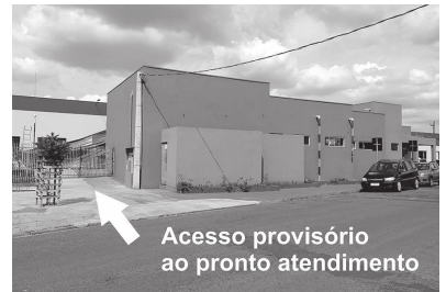
Acesso provisório ao pronto atendimento

"Sabemos que transtornos ocorrerão, porém são melhorias necessárias à estrutura física do hospital, visto que há uma despadronização dos pisos existentes, apresentando desgaste acentuado e dilatação das juntas, fazendo com que as peças 'estufem' ou se quebrem. Sendo assim, pedimos a compreensão e a paciência de toda a população, pois será um período atípico nas atividades da Santa Casa, porém necessário à intenção de oferecer um