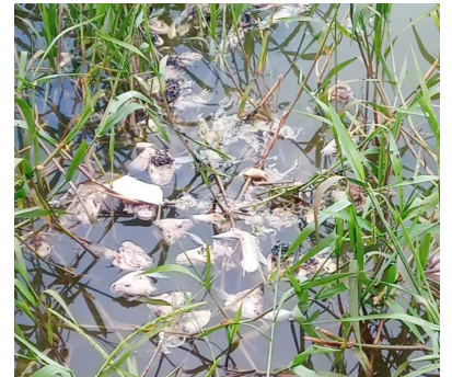
CIDADE Página 3