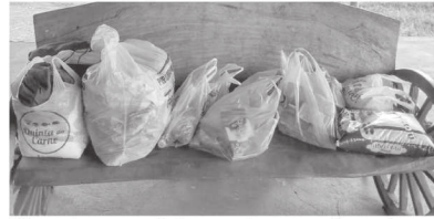
Alimentos arrecadados e entregues pela equipe do Grêmio Alexandria

Arrecadação No último final de semana, o Time do Grêmio Alexandria fez arrecadação de alimentos também em favor do Fundo Social de Solidariedade, que fo-