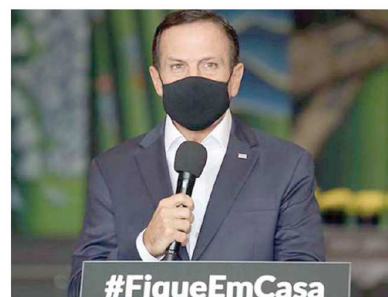
Segundo João Doria, medida inclui mais 171 leitos de enfermaria e 167 de UTI em serviços de saúde estaduais, municipais e conveniados ao SUS

As expansões da rede são resultado do mapeamento e análise técnica das capacidades estruturais de cada hospital, aliado ao monitoramento do cenário da COVID-19, visando salvar vidas e assegurar atendimento igualitário à população.