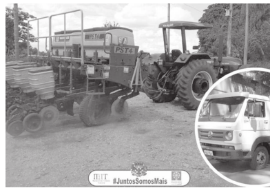
No momento, o município já conta com 90% da colheita de soja concluída, e de

Estes serviços são uma forma de incentivar os pequenos e médios produtores rurais da cidade, principalmente aqueles que têm sua renda proveniente da agricultura familiar. Com o trabalho da Patrulha Agrícola Mecanizada, a Casa da Agricultura de Pedrinhas Paulista também dá assistência técnica e acesso a projetos para as propriedades para cada vez mais melhorar a sua produção.