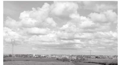
Contemplado através de edital pela Lei Aldir Blanc, documentário pretende resgatar a origem de CM

A Lei Aldir Blanc beneficiou em Cândido Mota, espaços culturais e artísticos, agentes culturais, e atividades artísticas e culturais. No dia 24 de fevereiro, na Câmara de Vereadores de Cândido