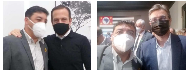
Prefeito de CM participou de encontro com governador e vice-governador