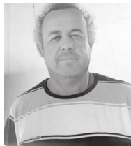
anos e faleceu na madrugada desta segunda-feira, dia 7