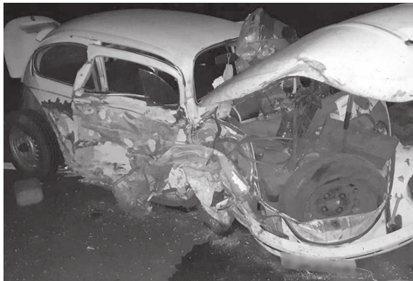
Da Redação Cândido Mota

Um grave acidente ocorrido na noite de sexta-feira, dia 4, ocasionou uma vítima fatal na rodovia 'Fortunato Petrini' (SP 266), entre Cândido Mota e o distrito de Frutal do Campo. A colisão frontal, envolvendo um veículo