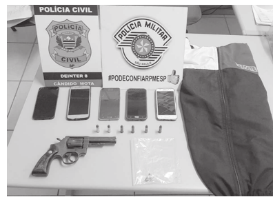
"Após a análise das imagens das câmeras de monitoramento que flagram o ilícito, bem como dos depo-

Foram expedidos dois mandados de prisão temporária e sete de busca e apreensão, cumpridos por 11 policiais civis, 18 policiais militares e 12 viaturas policiais. Os policiais cumpriram os dois mandados de prisão temporária, contra W.P.F e J.C.B.D.C, que foram capturados, sendo o último também em flagrante por posse irregular de arma de fogo de uso permitido e drogas para consumo pessoal. Durante buscas domiciliares foram apreendidos uma arma de fogo calibre .38, seis munições .38, cinco aparelhos celulares e 1,25 grama de substância entorpecente.