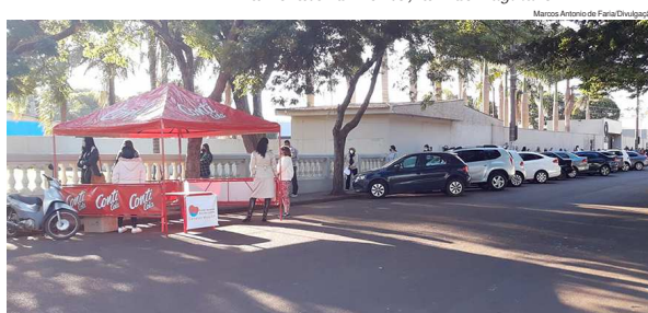
A vacinação acontece no CRB, das 8h às 13h, porém vale ressaltar que pode ser encerrada mais cedo, conforme disponibilidade de doses

secretária municipal de Saúde, Vânia Cavalcante, pede para que seja feito um pré-cadastro, através do site vacina.sp.gov.br. saú- de Página 3