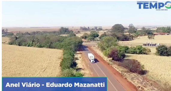
Anel Viário - Eduardo Mazanatti

A prefeitura de Cândido Mota, através da Secretaria de Obras e Serviços Públicos, está realizando melhorias no anel viário 'Eduardo Mazanatti'. De acordo com a pasta, está sendo feito serviço de limpeza e obras para escoamento de águas pluviais no entorno da via. CIDADE Página 8