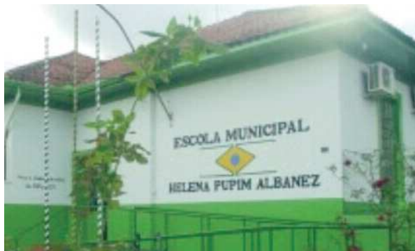
Alunos da escola municipal 'Helena Pupim Albanez' retorna aulas nesta 2ª

O retorno obriga que todas as instituições de ensino que funcionem no município de Cândido Mota sigam os protocolos sanitários específicos para o setor da educação,