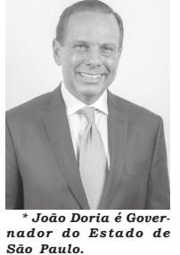
* João Doria é Governador do Estado de São Paulo.