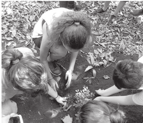
Projeto Meio Ambiente e Cidadania visa transformar o mundo por meio da Educação