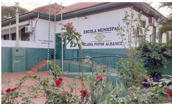
‘Helena Pupim Albanez’ suspendeu aulas presenciais por 14 dias