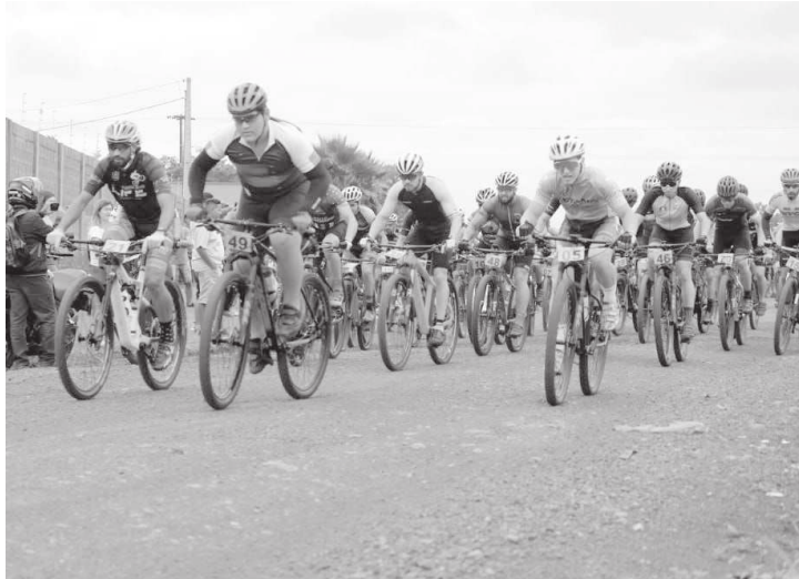
Da Redação Cândido Mota

Aconteceu no último domingo, dia 17, em Cândido Mota, com a presença de mais de 100 ciclistas da região e norte do Paraná, o 4º Rachão MTB Ciclo Izzo. O evento teve quatro categorias, sendo Elite Livre, Masculino de 40 a 49 anos, Masculino acima de 50 anos e categoria Feminino Livre, em um percurso de 45 quilômetros de estradas rurais, com chegada pela 'estrada no lixão', nas casas populares.