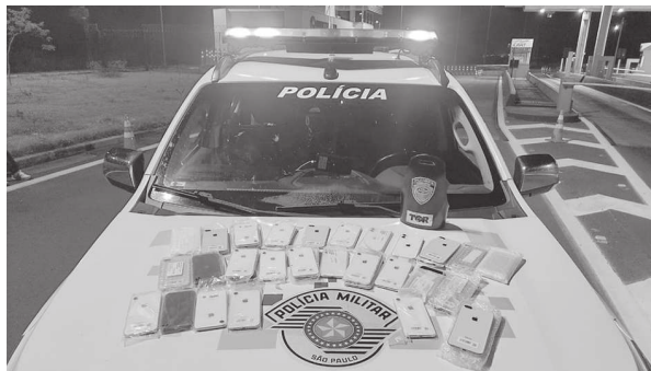
Um inquérito por descaminho foi instaurado e os indicados foram encaminhados à cadeia pública de São Pedro do Turvo.

Dois ocupantes do veículo GM Corsa, e os 36 eletrônicos, que estavam sem notas fiscais, foram apresentados na sede da Polícia Federal de Marília.