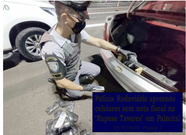
Polícia Rodoviária apreende celulares sem nota fiscal na 'Raposão Tavares' em Palmital