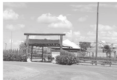
As instalações da estrutura da 15 Coopershow esta dentro da programação

26, 27 e 28 de janeiro de 2022, mantendo o foco na apresentação de diversos experimentos, no trabalho com a cultura de milho, soja, mandioca, banana, cana-de-açúcar, trigo, adubação verde, dentre outros. Os ensaios envolvem o controle de ervas daninhas, técnicas de manejo pós-colheita, análise de nutrição de