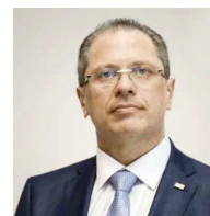
* Jean Gorinchteyn, médico infectologista, é Secretário de Estado da Saúde de São Paulo

Nesta semana, liberamos as máscaras em ambientes abertos, um passo seguro diante do atual cenário epidemiológico. Respeitando a Ciência e com foco na Saúde e na vida, São Paulo vai deixando para trás um dos momentos mais tristes da nossa história. Seguiremos trabalhando com foco na população. Viva a vacina, viva a vida!