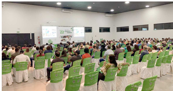
Da Redação Cândido Mota

A agência Sicredi de Cândido Mota reuniu mais de 300 associados durante o período