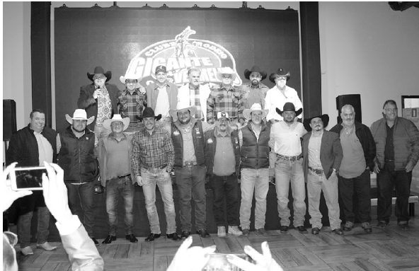
Comissão organizadora da festa do peão 'Gigante Vermelho 2022'