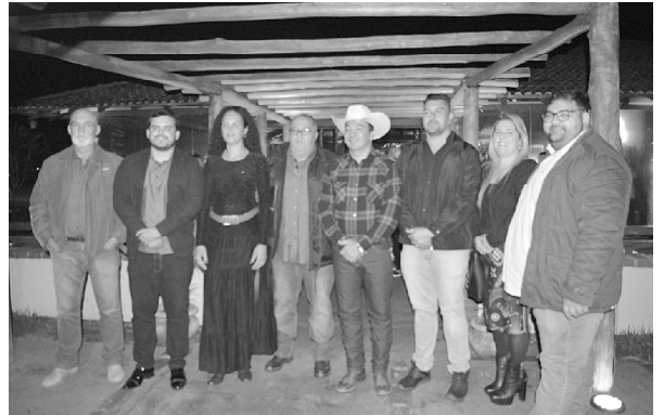
Prefeito, vice e vereadores acompanharam lançamento da festa

Comissão antecipa expectativa para os 100 anos de Cândido Mota em 2023