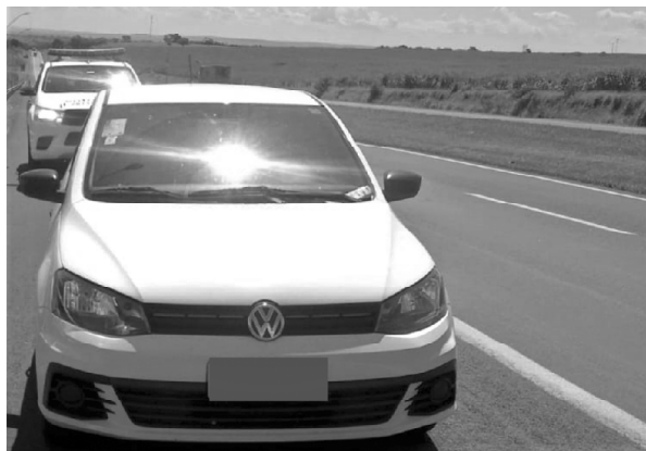
Altas consecutivas no preço dos combustíveis estão entre possíveis causas da maior incidência deste tipo de ocorrência

Em todo o trecho da Entrevistas, usuários po-