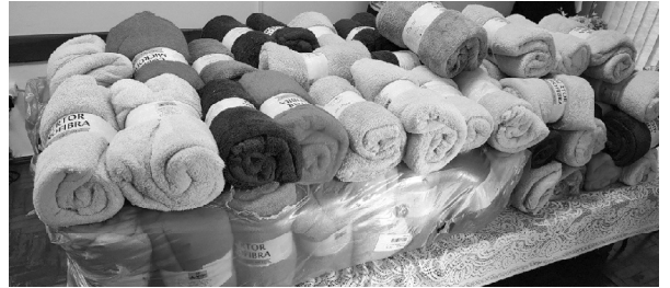
Da Redação Tarumã

Na tarde de quinta-feira, dia 26, o Fundo Social de Tarumã recebeu a doação de 100 cobertores realizada pela empresa Energisa - Regional Assis.