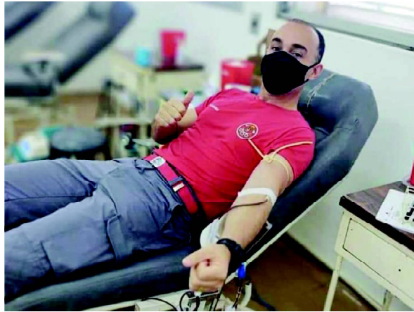
Da Redação Cândido Mota

A Estação de Bombeiros de Cândido Mota, pertencente ao 4º Subgrupos de Assis, do 14º Grupo de Bombeiros de Presidente Prudente, está participando da