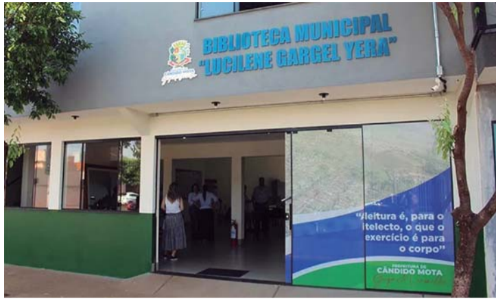
Da Redação Cândido Mota

Acontece entre os dias 23 e 30 de abril, a 1ª Exposição de Artistas Autistas de Cândido Mota/SP. A apresentação realizada pela Associação Cândido-motense de Apoio à Pessoa com Transtorno de Espectro Autista (Aucatea), com apoio da Prefeitura do município, será aberta a toda população na Biblioteca Municipal 'Lucilene Gargel Yera', das 8h às 16h. “Importante é não só sa-