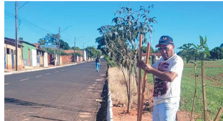
LUTÉCIA Página 8

Prefeitura de Lutécia investe na arborização urbana