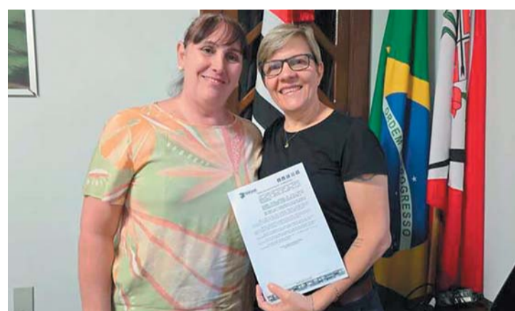
TARAMÃ Página 6