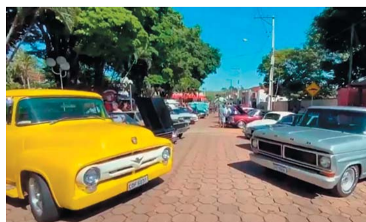
LUTÉCIA Página 7