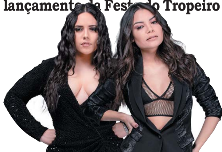
TARUMÃ Página 4