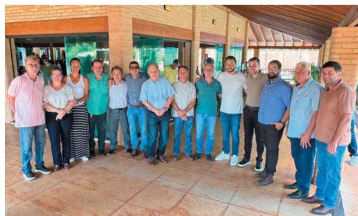
LUTÉCIA Página 5